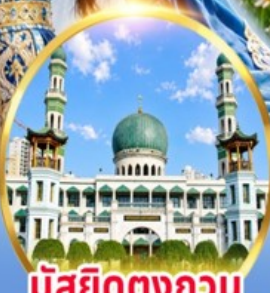
มัสยิดตงกวน