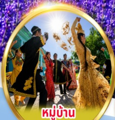
หมู่บ้าน วัฒนธรรมอุยกูร์