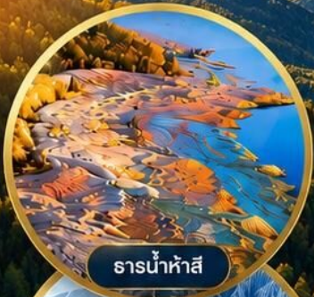
ธารน้ำห้ำสี