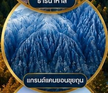
แกรนด์แคนยอนซูยกุน