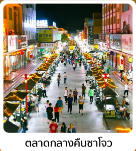
ตลาดกลางคิ่นซาโจว