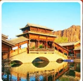
เมืองเล็กตันเสี่ยโซ่ว