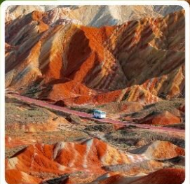
ภูเขาสายรุ้งจากเย่