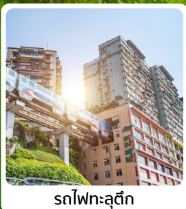
รถไฟทะเลตุ๊ก