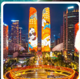
ตึกแฝดเจิงตุ