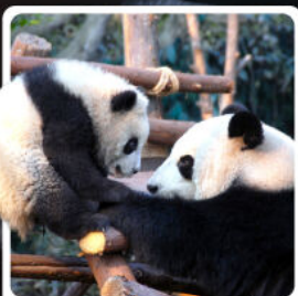
หุบเขาแพนด้าดูเจียงเอี้ยน