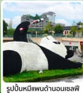
รูปปั้นหมีแพนด้าบนเฉลยี่