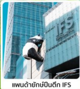
แพนด้ายักษ์ปีนตึก IFS