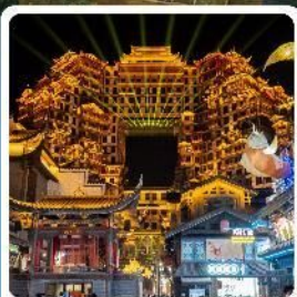
ตึกหัตถจารย์ 72