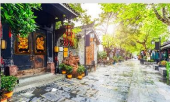
ซอยกว้างชอยแคบ