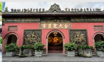
วัดต้าเจี๊ว

*ทางบริษัทฯ ขอสงวนสิทธิ์ในการสลับโปรแกรมทัวร์ตามความเหมาะสมขึ้นอยู่กับสถานการณ์หน้างาน โดยคำนึงถึงผลประโยชน์ของลูกค้าเป็นสำคัญ