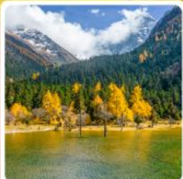
อุทยานแห่งชาติปี้เฟิงโกว