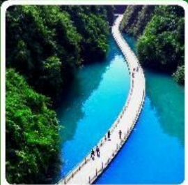
ขุนเขาสิงโต

• ไฮไลต์ อุทยานเทียนเหมินซาน ประตูละออวี่ ตึกมหัศจรรย์ 72 หมู่บ้านโบราณฟูรงเจิน ภูเขาไรซ่าอู่เจียโต อุทยานซ้อจ้อกวนด่านสิงโต