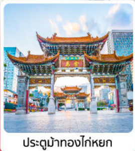
ประตูม่านทองไค่หยก