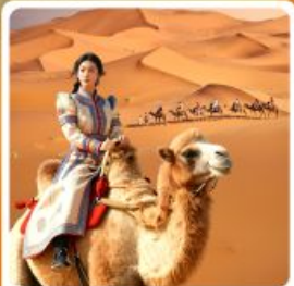
ขี่อู่อู่อ่าทะเลทราย