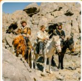
ชาวมองโกล