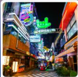
ถนนคนเดินซินหยุน