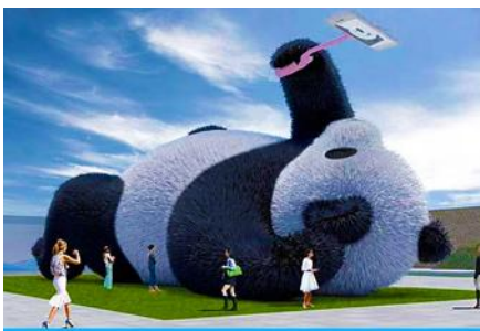
ตุ๊กตาแพนด้าบนเซลล์ฟี

หลังอาหารนำท่านเดินทางสู่ เมืองตูเจียงเยียน 都江堰 (ระยะทาง 234 กม. ใช้เวลาเดินทางราว 4 ชั่วโมง) ระหว่างเดินทางท่านสามารถชมทัศนียภาพธรรมชาติอันงดงามของสองข้างถนนขณะที่รถแล่นผ่าน ที่มีทั้งภูเขาหิมะสูง หุบเขา ธารน้ำ และทุ่งหญ้าบนที่ราบสูง หรือพักผ่อนตามอัชฌาศัยบนรถระหว่างเดินทาง