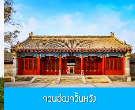
จวนอ๋องจวินหวัง

วันที่หก เมืองเออร์ดอส –อี้เค่อเอาเป่า–พิพิธภัณฑ์เครื่องเงิน-จวนอ๋องจวินหวัง- สวนวัฒนธรรมหมงกุ๋หยวน หลิว-ซ้อปิ้งถนนคนเดิน