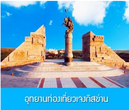
อุทยานท่องเที่ยวเจงกิสข่าน