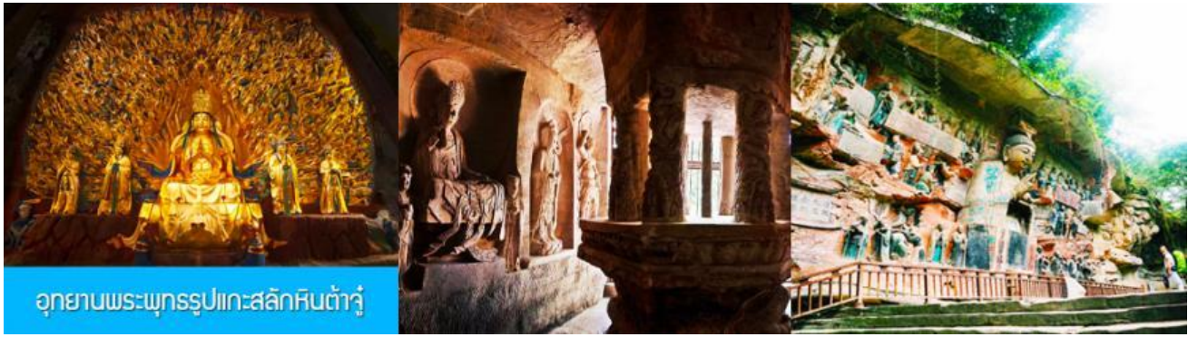
อุทยานพระพุทธรูปแกะสลักหินต้าจู่