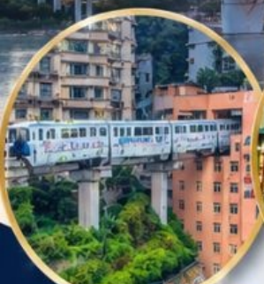
รถไฟทะลุตึก Liziba Station