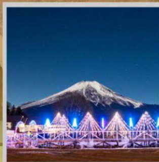
"YAMANAKAKO ILLUMINATION FANTASEUM"