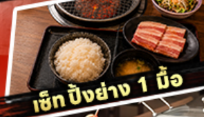
เช็ก ปังย่าง 1 มื้อ