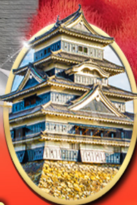
ปราสาทนัตสึโมโต้

รหัสทัวร์ RJ-VZNR004 เดินทาง 5D 3N ท.ย. - ต.ค. 69