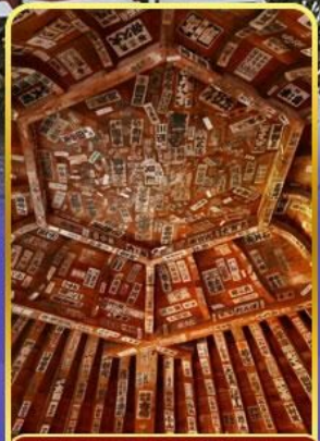
วัดซาเซเอโดะ