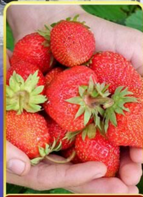
กิจกรรมเก็บสตอเบอรี่