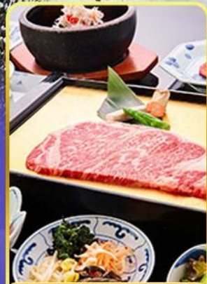
ROKKASEN พรีเมี่ยม