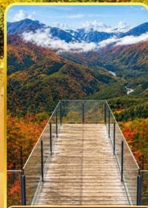
ฮาคุบะอิว่าตากะ