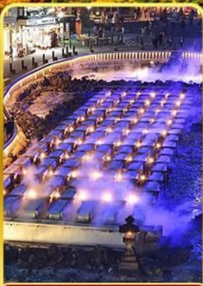
ชมยูบาตากะ