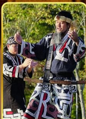
พืชรักที่โอนู