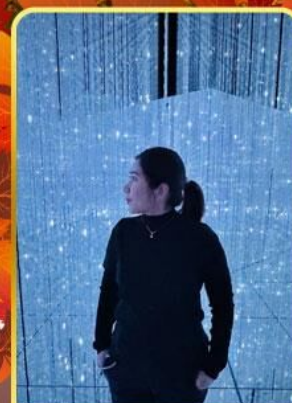
ทีมแอปโตเกียว