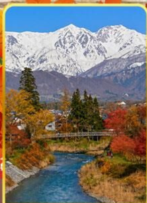
โออิเดะพาร์ค