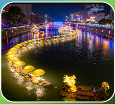
“ล่องเรือมังกรกัซสุ่ย”