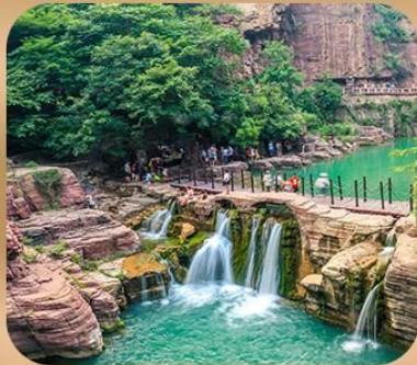
“อุทยานหยุนไท่ซาน”