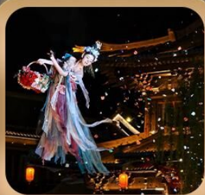
“เมืองโบราณลั่วอี้”

ชมถ้ำหลงเหมิน มรดกโลกที่เมืองลั่วหยาง • สุสานจิ้นซีฮ่องเต้ • ศาลเจ้ากวนอู วัดเส้าหลิน + ป่าเจดีย์ + ชมโชว์กังฟู • เมืองโบราณลั่วอี้ • อุทยานหยุนไท่ซาน เจดีย์ห่านป่าใหญ่ • ถนนวัฒนธรรมต้าถิง • ถนนคนเดินอิสลาม • จัตุรัสหอรบะซิง