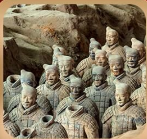
“สุสานจิ้นซีฮ่องเต้”