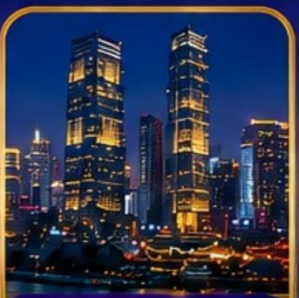
ตึกโค่วซิงไห่