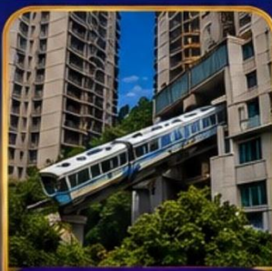
สถานีรถไฟฟ้ายักษ์