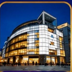
The Ring Mall