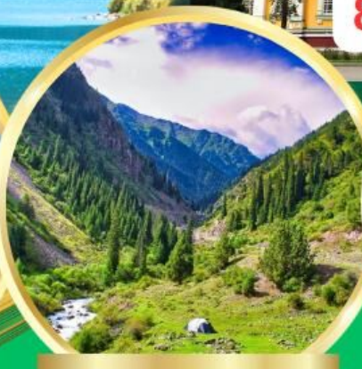
Ala Archa National Park