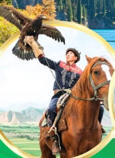
ชมโซว์นคอินทรีย์