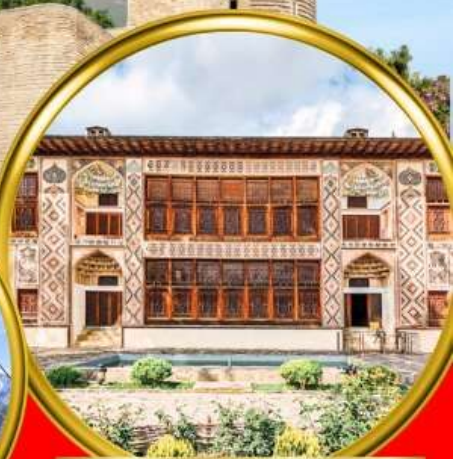
Palace of Shaki Khans