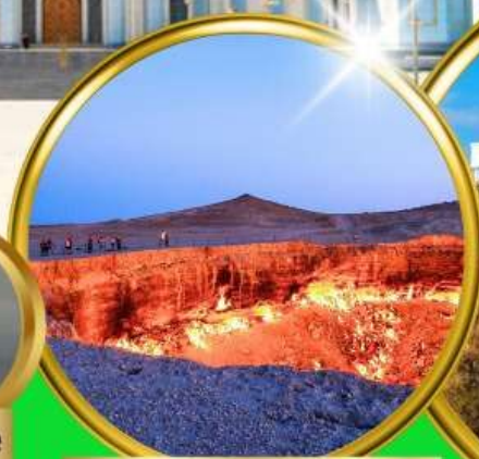
Darvaza Gate To Hell