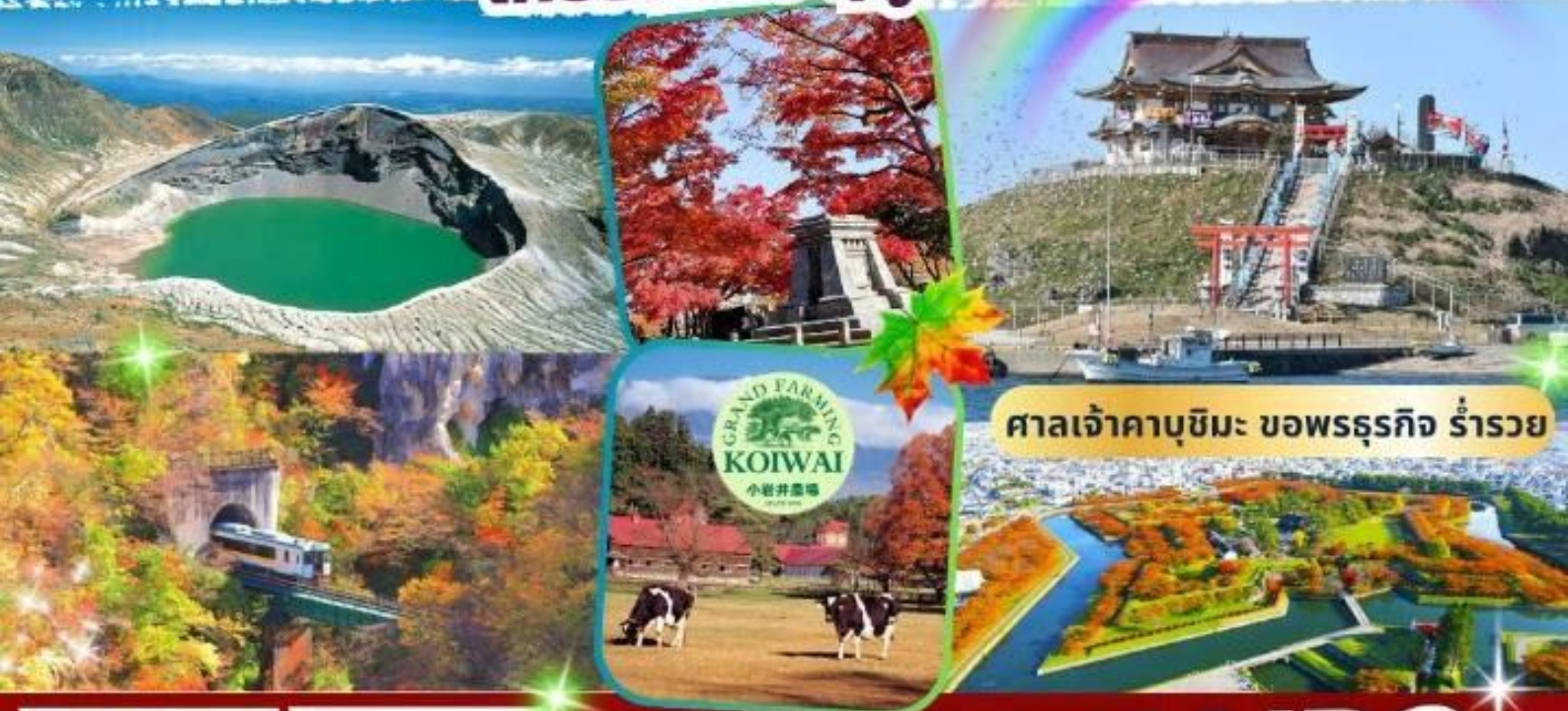
ศาลเจ้าคาบูชิมะ ขอพรธรรกิจ ร่ำรวย