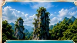
Enshi Puyan อุทยานหินเจินซือปุยหยา