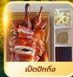
เปิดปีกถึง