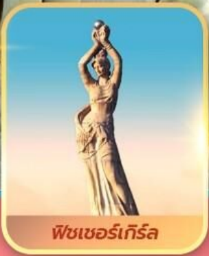
ฟิชเชอร์เกิร์ล