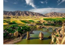
เมืองฮาซานคีฟ

** พักที่ Kardelen Hotel 4* หรือเทียบเท่า **