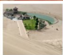
เขื่อนทรายหมิงซาซาน