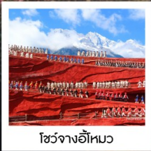
โซ่วจางอีหมว