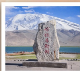
ทะเลสาบกาลากูเล่อ