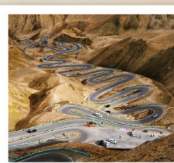
ถนนโบราณผานหลง