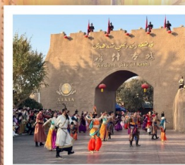
เมืองโบราณคัชการ