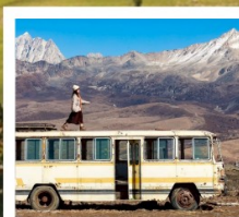
เมืองลอยฟ้าเกอตี้ลามู่