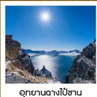
อุทยานอางโป่ซาน