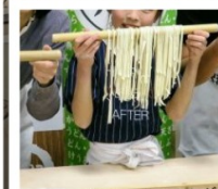
กิจกรรมทำเส้นอุด้ง