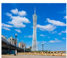
จัตุรัสฮัวเจิง