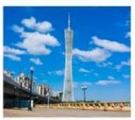
จัตุรัสฮั่วเจิ้ง