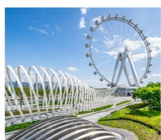
สวนสาธารณะ: OH BAY