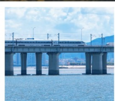
นั่งรถไฟใต้ดินข้ามทะเล