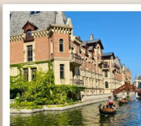
เวนิสแห่งต้าเหลียน