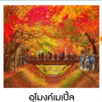
อุโมงค์เมบิชิ