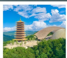
ภูเขาหนิวโถ้วซาน

อุทยานทะเลสาบไท่หู (รวมล่องเรือ) ถนนคนเดินซานตง • วัดจีหมิง ถนนอุ้งงูต้าเต้า • ห้างสรรพสินค้าเต๋อจี ภูเขาหนิวโถ้วซาน (รวมรถกอล์ฟ) สะพานแม่น้ำแยงซีเกียงนานกิง • ทะเลสาบเซวียนอู่ หมู่บ้านเหนียนฮวาวัน • โรงงานเซรามิกเถาอ้อต่าง เมืองโบราณเหย่าหู (รวมรถไฟเล็ก) • คุณซาน ถนนโบราณปาเจิง • North Bund Green Land STARBUCKS RESERVE ROASTERY THE LOUIS • ถนนหวยไห่ (SONG MONT)