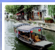
เมืองโบราณหนานสวิน