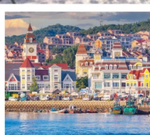
ท่าเรือประมงเขียวหนิงไถ

เรือบลูวิค / ย่านฮั่นเล่อฟาง / ถนนฮั่วจวิปา ท่าเรือประมงเขียวหนิงไถ / ย่านฮงโหว่ 1920 / ถนนโบราณเฉาหยาง หอคอยกาลเวลา / ชายหาดจินซา / รูปปั้นปลาวาฬ / หาดทรายซาจื่อโหว่ หาดไซเบอร์ NO.3 / โรงงานเบียร์ชิงเต่า / โบสถ์ St. Emil ถนนคนเดินไต้ตง / สะพานจันเฉียว / จัตุรัส 54 / ห้าง MIXC