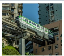
นั่งรถไฟทะลุติ๊ก