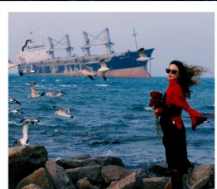
เรือควิวส

หอคอยกาลเวลา / รูปปั้นปลาวาฬ / ถนนโบราณเตาหยาง / ย่านสงโขว่ 1920 / เมืองเว่ยไห่ / ถนนฮั่วจวีปา / จตุรัสประตูแห่งความสุข ย่านอันลอฟาง / เรือควิวส / หาดซาจื่อฮั่ว / ถนนหลงเจียง / สะพานจันเจียว / หาดไซเบอร์ No. 3 ถนนจงซาน / โบสถ์ St.Emill / จตุรัส 54 / ศูนย์เรือใบโอลิมปิก / พิพิธภัณฑ์มิแยร์ชิงเต่า / ถนนโตตง / ท่าเรือประมงเหยียนโกะ