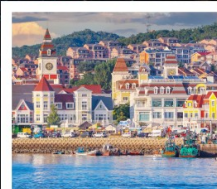
ท่าเรือประมงเหยียนโกะ